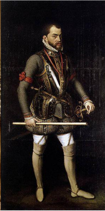
Filips II (1527-1598) op 30-jarige leeftijd