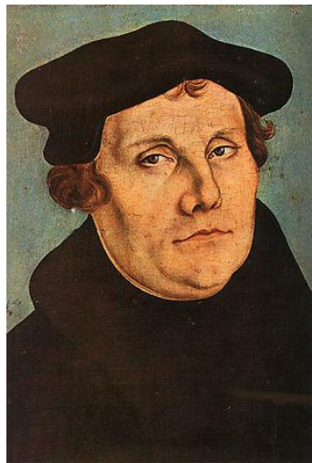
Maarten Luther (1483-1546) portret uit 1529