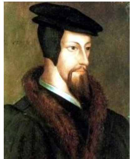
Johannes Calvijn (1509-1564)