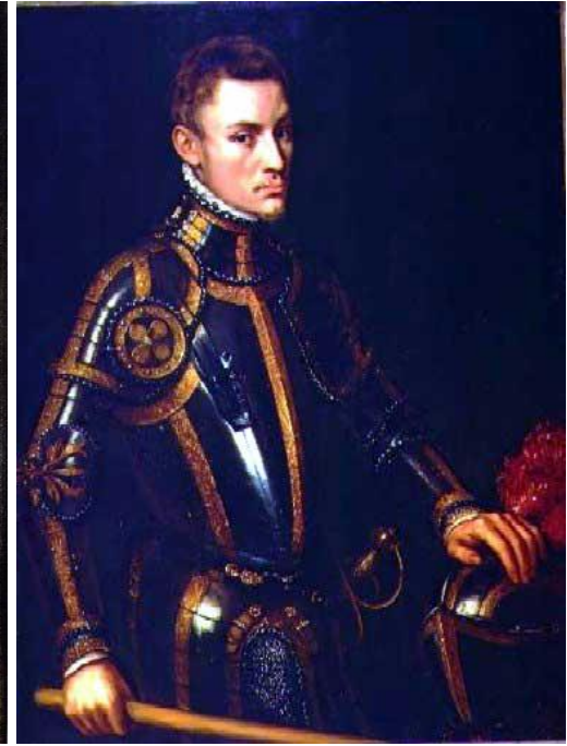
Willem van Oranje (1533-1584) op 22-jarige leeftijd