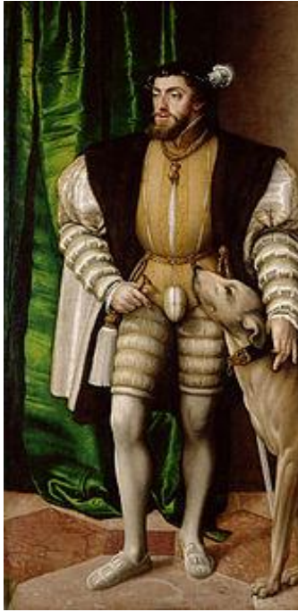
Karel V (1500-1558) op 32-jarige leeftijd