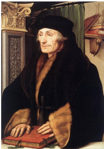
Desiderius Erasmus (1467?-1536) portret uit 1523